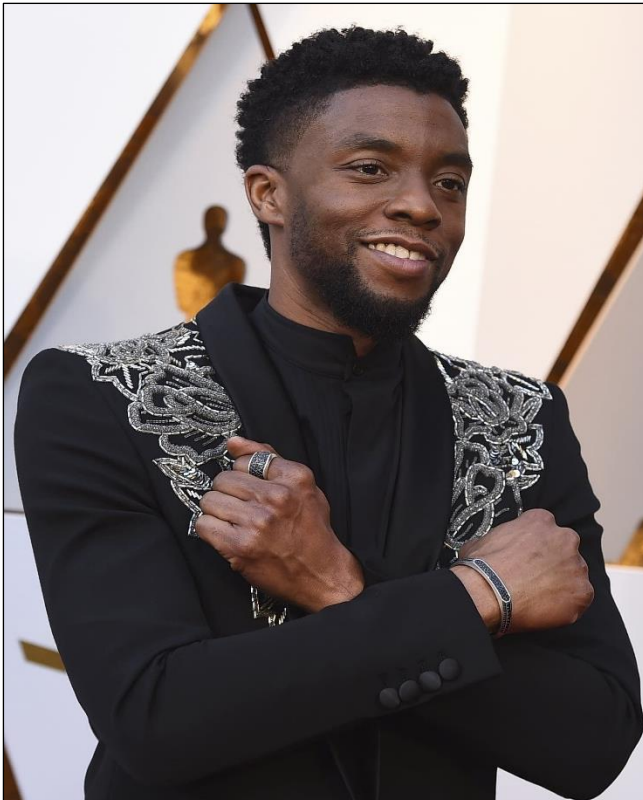
Un article de Nikan